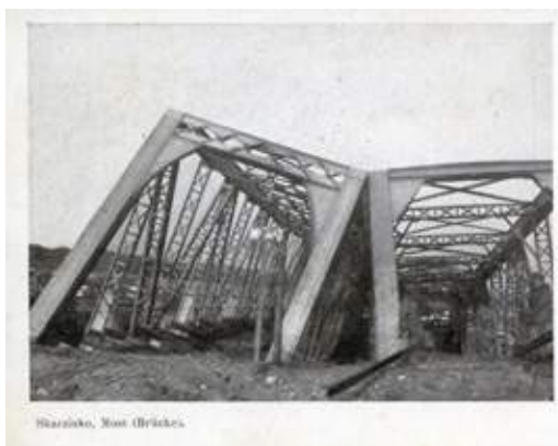
Wysadzony przez Rosjan most kolejowy na rzece Kamiennej, 1915 rok.