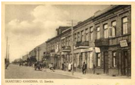
Ulica Hżecka, obecna 1 Maja, w okresie okupacji Główna, przed wojną Piłsudskiego.

Z powodu wzrostu liczby chętnych dzieci do nauki placówka otrzymała kolejne dwa oddziały i dodatkowo dwóch nauczycieli. Od stycznia 1919 roku funkcjonowała już jako 5-klasowa. Szkoła powszechna funkcjonowała w trudnych warunkach, ciasnoty i braku pomocy dydaktycznych. Niektóre zajęcia prowadzone były w pomieszczeniach kolejowych przy ulicy Niepodległości oraz w budynku przy ulicy Podjazdowej. Na szczęście dla szkoły najwięcej dzieci pochodziło z rodzin kolejarskich, i to właśnie pracownicy kolei oraz jej zarząd udzielali największego wsparcia finansowego oraz lokalowego. Działalność edukacyjna prowadzona w małym budynku i w obiektach kolejowych nie prowadziła jednak do skutecznego kształcenia dzieci, pomimo pracy na dwie zmiany i objęcia edukacją w szkole blisko 700 uczniów! By temu zapobiec szkoła organizowała