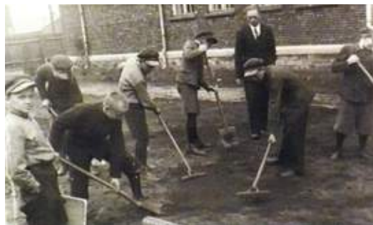
Prace uczniowskie przy porządkowaniu otoczenia szkoły, lata przedwojenne.

tów stał się węzeł kolejowy. Tu w Skarżysku miano stawiać opór niemieckim pancernym zagonom, jednak 8 września wojska polskie wobec grożącego im okrążenia wycofały się w kierunku Iłży, a do miasta wkroczyły oddziały drugiej dywizji lekkiej Wehrmachtu rozpoczynając okupację. Powołano nowe władze miejskie, zorganizowano nowe placówki policji i formacji militarnych, zmieniono kierownictwo Państwowej Fabryki Amunicji, węzła PKP, poczty, zakładów energetycznych oraz fabryki naczyń emaliowanych. Niemcy represjonowali społeczność, wyznaczono też