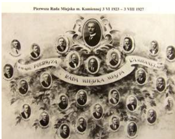
Pierwsza Rada Miejska Kamiennej 1923-1927.