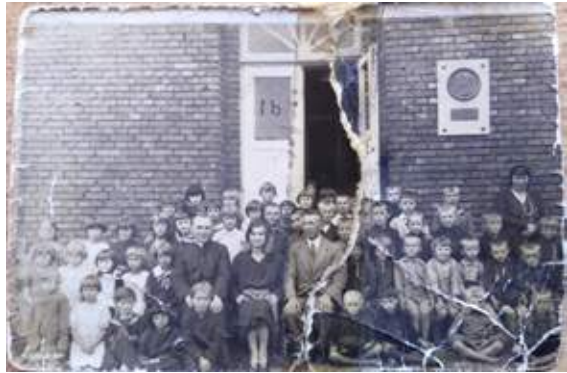
Klasa 1b, wrzesień 1935 roku, na elewacji szkoły widoczna pamiątkowa marmurowa tablica poświęcona Józefowi Piłsudskiemu.