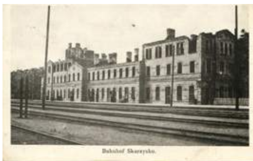
Dworzec kolejowy w Kamiennej, okres I WŚ.