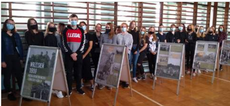
Klasa 2a pgim, uczestnicy projektu edukacyjnego w trakcie otwarcia wystawy plakatów "Wrzesień 1939".

Stowarzyszenie „Erbel – Szkoła Przyszłości” opracowało projekt edukacyjny „Pamięć i patriotyzm – I Liceum Ogólnokształcące im. Juliusza Słowackiego w Skarżysku-Kamiennej dla Ojczyzny wielkiej i małej”. Na projekt składały się: zorganizowanie przez uczniów klasy za wystawy plakatów przedstawiających agresję sowiecką i niemiecką w 1939 roku pt. „Wrzesień 1939” oraz opracowanie referatu pt. „Historia „Naszej” szkoły w okresie II RP i lat okupacji 1939-1945”. Członkowie-założyciele Stowarzyszenia opracowali graficzną wersję tableau upamiętniającego Marszałka Józefa Piłsudskiego, które nawiązuje swoją formą do pamiątkowej tablicy marmurowej z 1935 roku. Podsumowaniem projektu było spotkanie w dniu 9 października 2020 roku.