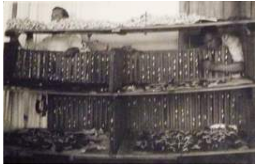
Hodowla jedwabników w Szkole Powszechnej w Kamiennej.