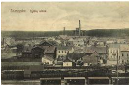
Skarżysko, widok ogólny, pocz. XX wieku.

Zależność tą widać w zachowanych dokumentach szkoły rozwojowej 4-klasowej w Kamiennej, z roku szkolnego 1918/19. Do szkoły zgłosiło się na początku 500 dzieci, z powodu braku funduszy i lokali przyjęto 406, dziećmi opiekowało się 5 nauczycieli... więc statystycznie jeden pedagog zajmował się 80 dziećmi!