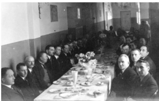
Resursa Rzemieślnicza, uroczysta kolacja po wmurowaniu kamienia węgielnego, 1926.