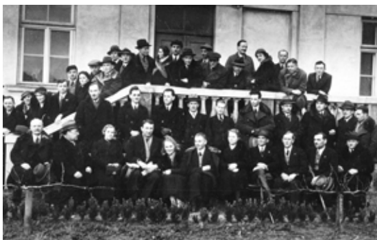
Spółeczny Komitet Budowy Szkoły Powszechnej